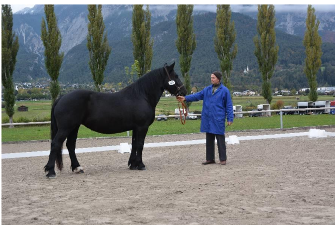
Lavinia, Bals Thomas, Häselgehr V: Steinberg Vulkan XVII